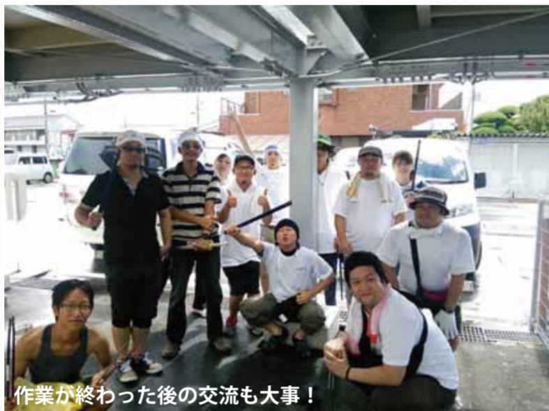
作業が終わった後の交流も大事！

今回は、老若男女問わず様々な方が楽しみながら、岩出市内の道路や河川敷をきれいにする地域清掃ボランティア活動を毎月2～3回実施している「和歌山ちょこっと街美化」（通称マチピカ）をご紹介します。