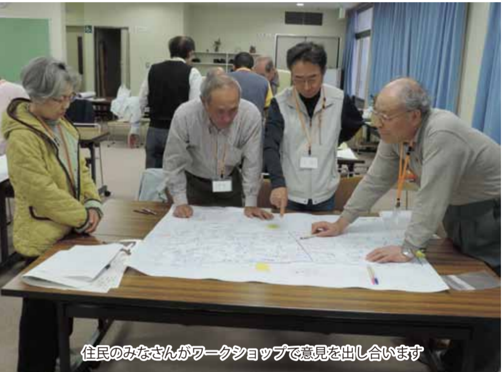
住民のみなさんがワークショップで意見を出し合います

に基づき「命をつなぐ避難路」をテーマとした自治会単位での避難計画の作成や、まちづくりの一環として、下水道事業や都市計画道路、狭い道路の改善