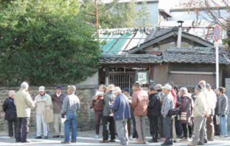
まちを実際に歩いて気になるところをチェック

和歌山市今福地区で、自分たちが住む住環境を少しでも良くしていくため、まちづくりに積極的に取り組んでいる「NPO 法人愛福会」があります。愛福会はまちづくりに活発的に参加することによって、安心・安全で、持続的に、地域を大切に住民が暮らす「まち」をめざして、様々な活動を展開しています。