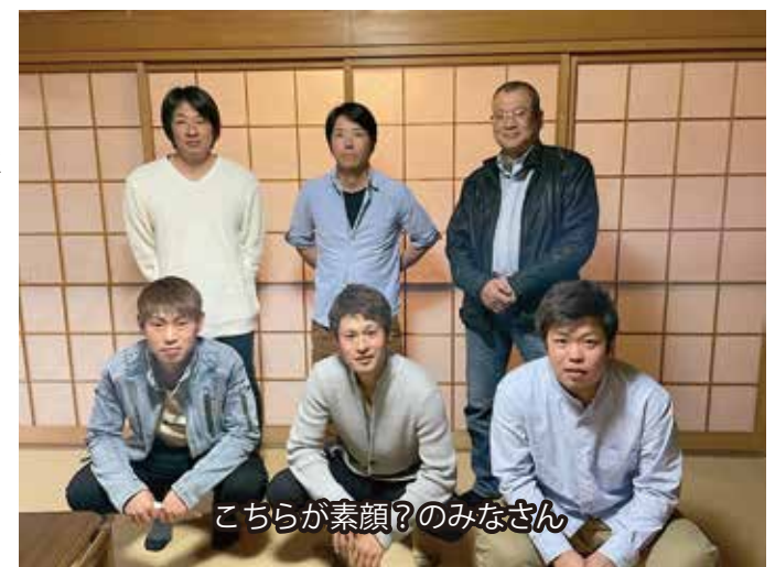
こちらが素顔?のみなさん