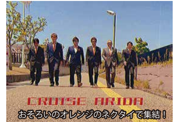
CRUISE ARIDA おそろいのオレンジのネクタイで集結!

そんな矢先、世界中で新型コロナウイルス感染症が蔓延しはじめ、ニュースでは、コロナの影響で多くの子どもたちが困っていると報道がされました。そこで、困っている子どもたちにみかんを届けようという話がありました。