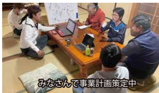
みなさんと事業計画策定中