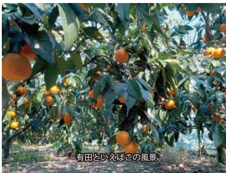
有田といえばこの風景

また、医療機関の疲弊が取りざたされていると知ったみなさんは「さっそくインスタグラムを利用し、コロナ対策で頑張っている医療従事者にみかんを使った製品を贈ろうと、医療従事者の家族でも申請できるように呼びかけました。」