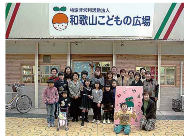
和歌山こどもの広場 (みその商店街内)