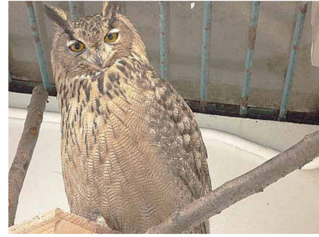
お城の動物園の動物たち