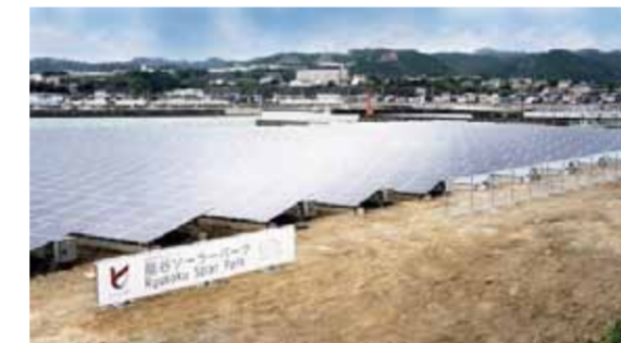
龍谷大学が国内大学初の SRI (社会的責任投資) により印南町に設置した地域貢献型メガソーラー発電施設「龍谷ソーラーパーク」。売電による収益は、京都・和歌山の NPO 支援、印南町の青少年育成などに役立てられる予定です。