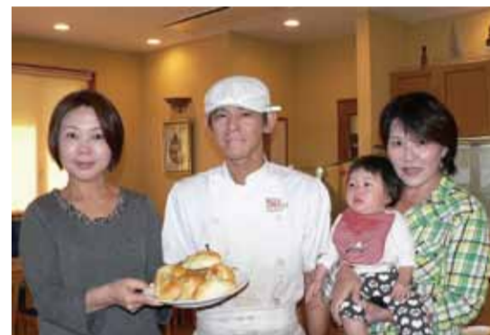
わかかつく第75号で紹介した「キフパン」。この収益金を元にした子どもの虐待防止のための講座とワークショップが昨年12月26日に美浜町で開催されました。

源になり始めています。いま地域に広がる「閉塞感」は高度経済成長期のような考え方による価値観に寄るところが多いのではないのでしょうか。今後を長いスパンで見据える、エネルギー、食料、介護などの課題のあり方がこれまでと急激に変わっていくものと思えます。その点、和歌山には希望が多いと思います。